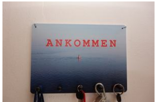
A N K O M M E N - Willkommen !