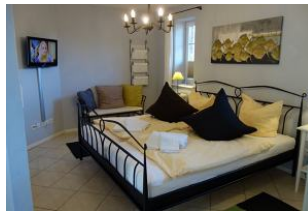
Großes Schlafzimmer im Erdgeschoß mit Doppelbett und zus. TV-Gerät