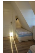
...eins versteckt in einer Nische, dies ist nur 85cm breit, aber auch 200cm lang