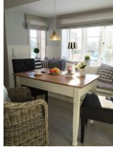
...der kleine Essplatz.....