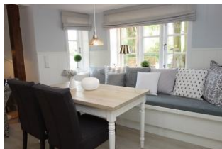
...ein Plätzchen für den Kaffee zwischendurch....