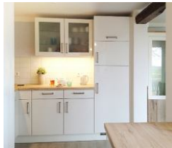
...und der andere Teil für Geschirr etc.