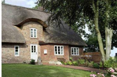
Das Haus WattGut in Oevenum

Die Unterkunft verteilt sich über EG und 1.OG.