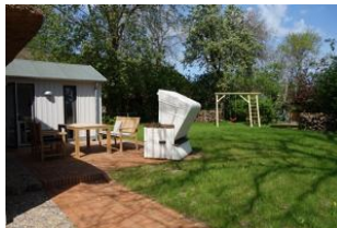
Die Terrasse hinter dem Haus mit dem Garten - nur für Sie zu nutzen. Der Austritt auf die Terrasse befindet sich im Essbereich