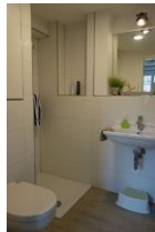
Das Duschbad im Erdgeschoß