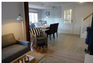
Blick vom Wohnzimmer zum Eingangsbereich