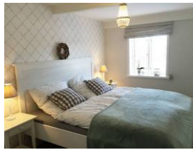
Das Doppelschlafzimmer (Bettmaß 180x200cm) im Erdgeschoß mit ...