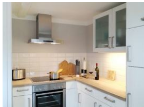
...und die Elektrogeräte dürfen natürlich auch nicht fehlen.