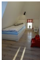
Das Kinderzimmer verfügt über zwei Einzelbetten, 90x200cm