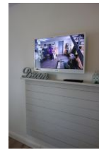
...Flachbild - TV - Gerät