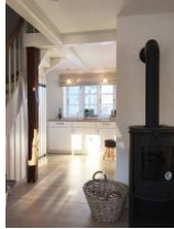
Der Blick vom Wohnzimmer zur Küche, vorbei am dänischen Ofen.