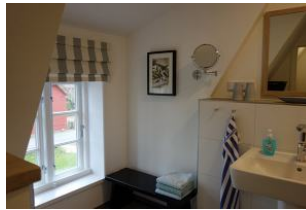
Das Bad im OG mit Handwaschbecken....