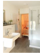
... und Duschkabine. Die Sauna steht Ihnen kostenfrei zur Verfügung !