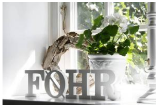
FO E H R