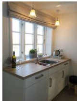
Ein Teil der Küchenzeile.