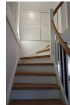
Die Treppe ins Obergeschoß