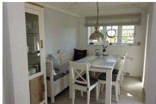
Der herrliche Essplatz im Anbau mit Blick in den Garten und Zugang zur hinteren Terrasse