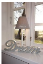
I had a dream.....