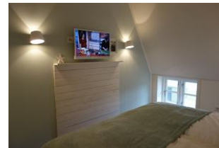
... ebenfalls mit Flachbild - TV - Gerät