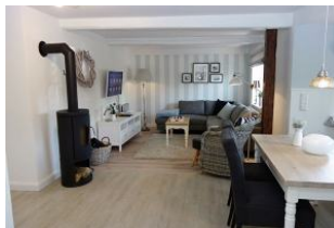
...der Blick in die gemütliche Sitzecke