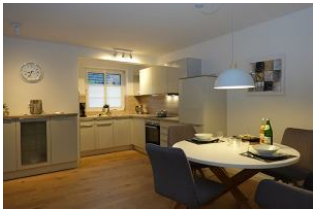
im Vordergrund der runde Esstisch, im Hintergrund die Küche.