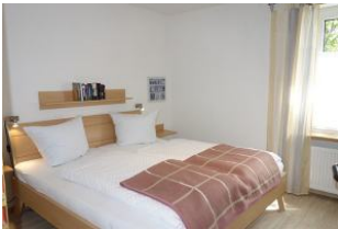
Das Schlafzimmer mit Doppelbett...(180x200cm)....