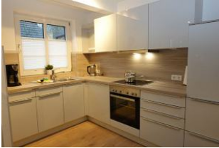
...die neue Einbauküche (2024) mit Geschirrspüler und Backofen.