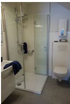
Das Bad im Ganzen...