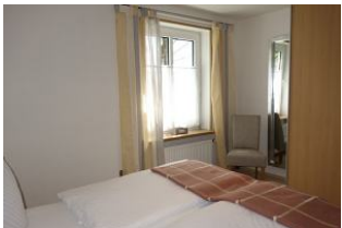
....und Fenster sowie großem Kleiderschrank