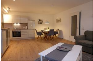
Das Wohnzimmer: großzügig und gemütlich, neu gestaltet !