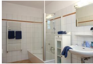
Das Bad mit Badewanne (+Duschkmöglichkeit)