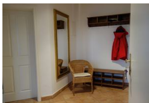
Der Flur mit Garderobe und Schuhablage