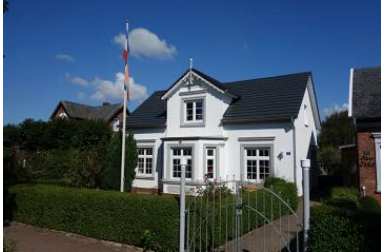
Villa Hansson, Boldixumer Str. 14 in Wyk auf Föhr