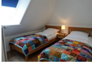
Das Schlafzimmer mit zwei Einzelbetten, und ...