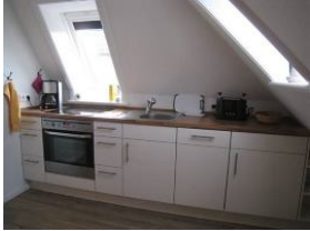
...die offene Küchenzeile hat "alles, was man so braucht!"