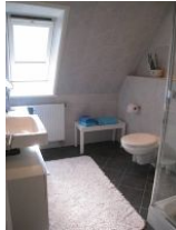
Das geräumige Bad mit ...