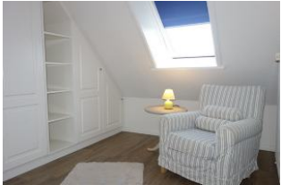
Ankleidezimmer mit großem Sessel.