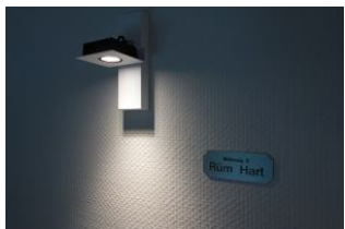
Die Wohnung 3 - Rüm Hart lädt ein .....