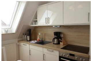
Die Küchenzeile in der sep. Küche