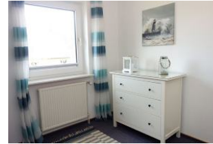
Kommode für Kleidung, Spielsachen etc.