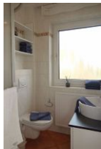
Das Bad mit großem Fenster...