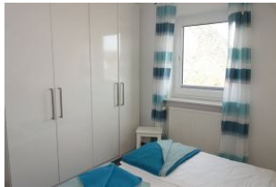
In den Kleiderschrank passt viel hinein...