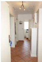
Treten Sie ein...herzlich Willkommen!