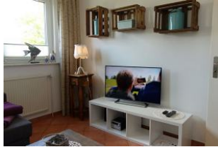
Das TV Gerät darf natürlich auch nicht fehlen...