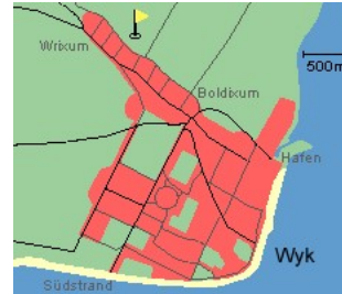
Entfernungen, zirka: zum Bäcker 100 m, zur Einkaufsmöglichkeit 3,0 km, zum Flugplatz 4,0 km, zum Golfplatz 4,2 km, zum Hafen 3,5 km, zum Meer 3,5 km, zum ÖPNV 100 m, zum Badestrand 3,5 km, zum Ortszentrum 100 m