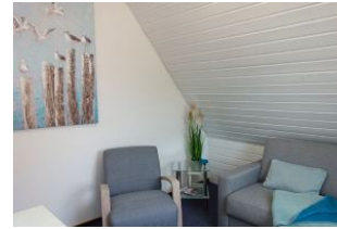
...und gemütlichem Sessel für ein Lesestündchen ?