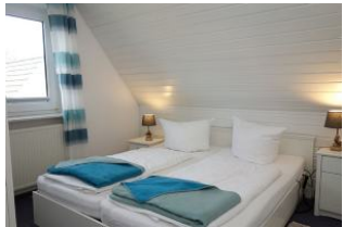
Das große Doppelbett misst 180x200cm ohne Fußteil