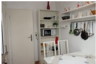
...alles in greifbarer Nähe.