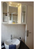
...Handwaschbecken und Spiegelschrank