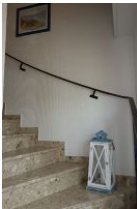
Das Treppenhaus führt zu beiden Wohnungen