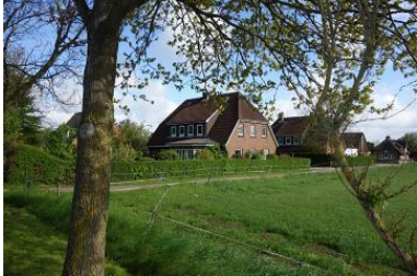
Das Haus Hardesweg 9