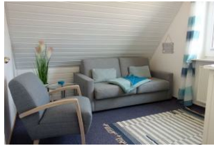
Das zweite Schlafzimmer mit Doppelschlafcouch