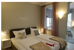
...hier dürfen Sie ausschlafen.