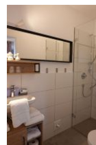
...großem Spiegel. Nicht im Bild die Toilette