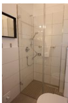
...bodengleicher Dusche und...