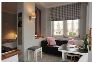
Das App. 2 im Haus Hallig Hooge

Ruhig gelegen, inmitten unseres kleinen Städtchens Wyk finden Sie unser Haus Hallig Hooge, welches insgesamt 7 Wohnungen für jeweils 2 Personen beherbergt. Klein, aber oho präsentiert sich auch das App. 2 - Nordstrandischmoor; ein großzügiges Einraum - Appartement für 2 Personen. Kleiner Wohnbereich mit Küchenpantry, eine halbhohe Mauer trennt den Wohn- vom Schlafbereich. Zugang zum Duschbad. Ein kleiner Abstellraum dient dem Unterstellen von Koffern und Taschen.