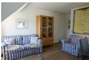
Couch und Sessel, beides sehr gemütlich, auch für einen langen TV-Abend geeignet.