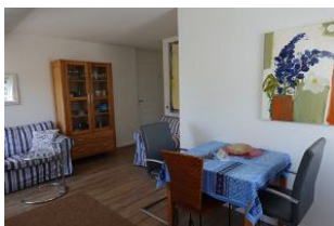
Ein Essplatz darf natürlich auch nicht fehlen