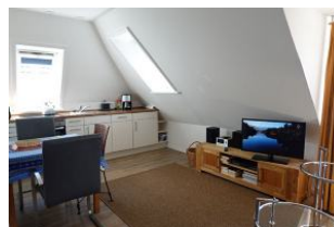
Das TV Gerät