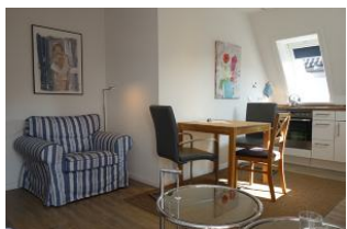
...großer Sessel, passend zur Couch.