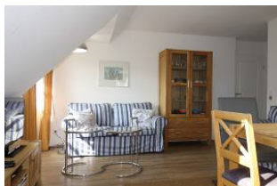
...mit gemütlicher Couch...