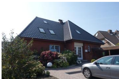
Die Außenansicht des Hauses Baben Dörp 13 in Wyk Boldixum