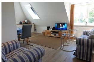
....treten Sie ein in diese "schnuckelige" Wohnung

Zauberhafte, helle Wohnung im 1.OG eines Zwei-Familienhauses. Im Juni 2011 komplett renoviert und mit viel Liebe zum Detail eingerichtet. Das Wohnzimmer mit offener Küchenzeile (sehr kommunikativ!), das Schlafzimmer mit zwei Einzelbetten, großem Einbauschränk und nicht zuletzt das neue Bad mit flacher Duschwanne für den bequemen Einstieg. Zudem wartet im Garten ein herrliches Plätzchen auf Sie....Lassen Sie es sich gut gehen und genießen Sie die Atmosphäre.