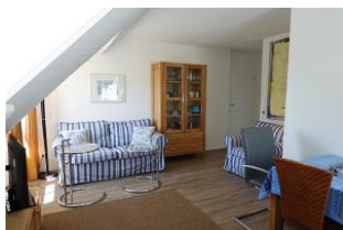
...und nehmen Sie platz für geruhsame Stunden.