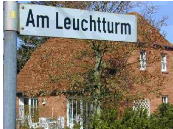
Das Haus Am Leuchtturm 1a

Die Unterkunft verteilt sich über EG und 1.OG.