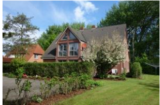
Das Haus Neshörn, Am Leuchtturm 4 in Wyk

Das Haus Neshörn ist zu erreichen über die Straße "Am Leuchtturm" Hausno. 4 liegt gemeinschaftlich mit der "Strandvilla" auf einem großen Grundstück der Familie Buchner/Petersen. Die Whg. 1 (Rungholt) befindet sich im EG mit herrlicher Süd - Terrasse. Der große Wohnraum mit offener Küchenzeile, das Schlafzimmer mit großem Doppelbett, das moderne Duschbad und nicht zuletzt die Nähe zum Strand, lassen das richtige Urlaubsfeeling aufkommen.