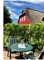
...Tisch und Stühlen.