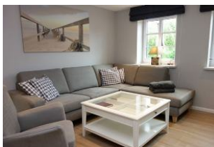
Die große Couch hat für alle ein Plätzchen

Der gemütliche Sitzbereich mit Blick zum Esstisch und zur Küche. Platz.