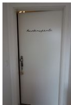
...seien Sie gespannt und treten Sie ein ....