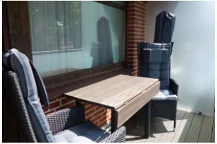
...ein Platz an der Sonne auf dem Balkon