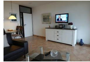
Das TV Gerät darf natürlich auch nicht fehlen...