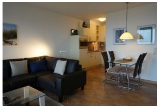
...die Eckcouch, im Hintergrund der Essplatz und die offene Küche