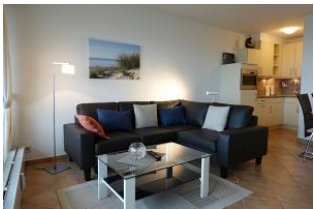
...wer mag sich hier nicht niederlassen ???