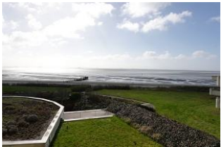
Der Blick auf das Meer - bei jedem Wetter faszinierend.