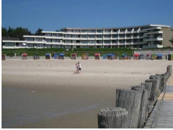
Das Haus Bi de Wyk vom Strand aus gesehen...