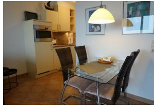
Der Esstisch, direkt vor der Küche - praktisch.