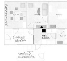
Grundriss der Wohnung 1 im EG der Villa Hansson