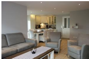
Die Sitzecke mit Blick zur Küche