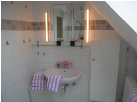
Das Badezimmer mit Waschbecken, Spiegel....