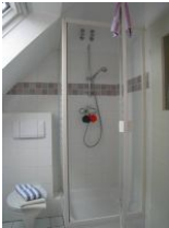
... Toilette und Duschkabine mit Echtglas