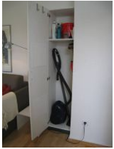
... der Staubsauger etc. bereit hält.