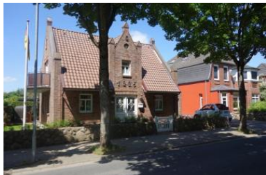
Das Haus Badestrasse 30a in Wyk

Die Unterkunft verteilt sich über EG und UG.