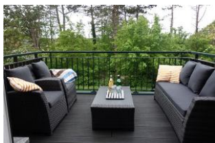
....entspannend, der Balkon mit Lounge Möbeln