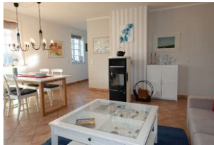
Der Ofen ist mit Holz zu füttern. Links im Hintergrund die Küche.