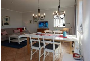
Der Esstisch. Im Hintergrund das TV Gerät und die Couch.