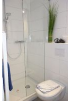
Die Dusche mit flacher Wanne, die Toilette