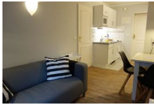
Der kleine Wohnraum mit Couch, Essplatz, Blick in die Küche

Ruhig gelegen, inmitten unseres kleinen Städtchens Wyk finden Sie unser Haus Hallig Hooge, welches insgesamt 7 Wohnungen für jeweils 2 Personen beherbergt. Auch die kleine Wohnung "Südfall" bietet Ihnen den Urlaubskomfort, den Sie suchen. Wohnbereich mit offener Küchenzeile, Duschbad und ein sep. Schlafzimmer mit zwei Einzelbetten machen Lust auf einen schönen, erholsamen Urlaub.