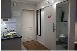
Die Küchenzeile, ein Blick ins neue Bad