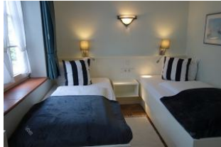
Das Schlafzimmer mit zwei fest eingebauten Einzelbetten