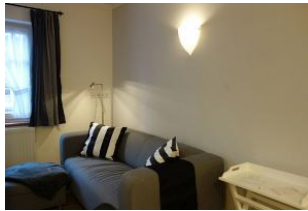
Hier noch einmal die Couch