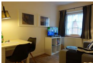
Der Esstisch, rechts TV Gerät