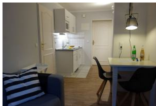
Der Essplatz. Im Hintergrund die Küche.