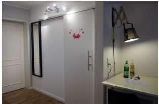
...ein großer Spiegel darf natürlich auch nicht fehlen.