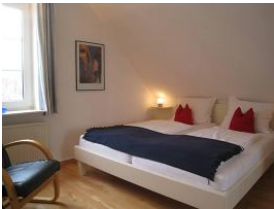
Das großes Doppelbett 180x200cm garantiert erholsamen Schlaf.