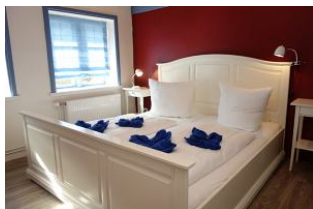
Das Elternschlafzimmer mit großem Doppelbett 180x200cm