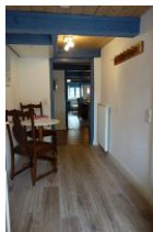
Der Flur mit großer Garderobe