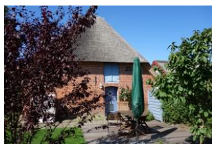
Der Blick von der Einfahrt zum Haus