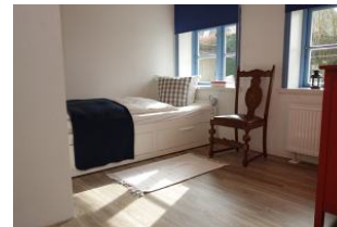
..und das dritte Schlafzimmer mit einem Einzelbett welches bei Bedarf noch ausziehbar und für 2 Pers. zu nutzen ist.