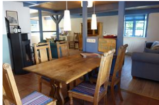
Der Essplatz, kurze Wege zur Küche