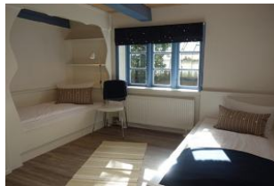
Das Kinderzimmer mit zwei Einzelbetten, wer es gern kuschelig mag, schläft im Kojenbett (normale Größe 90x200cm)