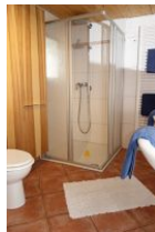
...und großer Duschkabine.