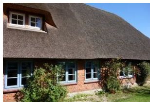
Die Rückansicht des Hauses, typisch friesisch !