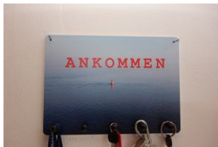
A N K O M M E N - Willkommen !