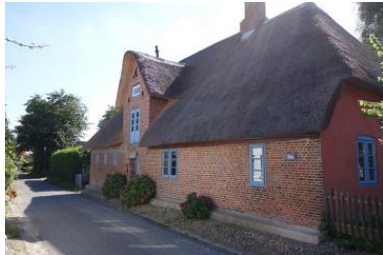
Das Haus Holm 17