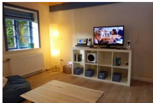
TV und Musik....