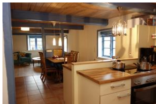
Ein Teil der Küche mit Blick auf den Essplatz und ins Wohnzimmer