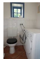
...und ein Extra-WC sowie Waschmaschine und Trockner zur kostenfreien Nutzung.