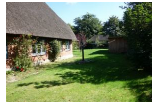
Ein Teil des Gartens