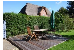
Die 16qm große Holzterrasse, im Sommer steht hier auch ein Strandkorb