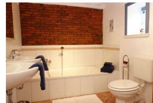
...Badewanne und Toilette ....