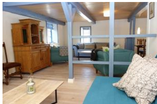
der offene Raumteiler trennt die Ofenliebhaber von den Fernsehliebhabern .....