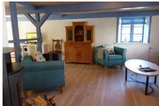
Zwei gemütliche Sessel für den Abend am Ofen ?