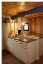
.....der andere Teil der Küche