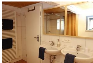
Das großzügige Bad mit Handtuchheizung und zwei Waschtischen....