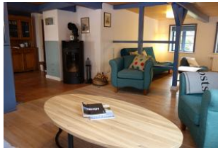
Der dänische Eisenofen