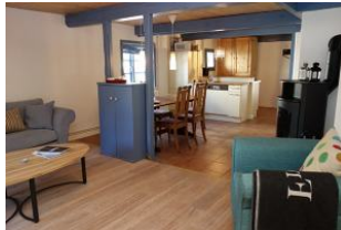
Herrlich diese offenen Räume, hier vom Wohnzimmer aus der Blick zum Essplatz und zur Küche