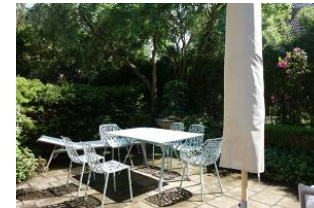
...herrlich eingewachsene Terrasse, Tisch und Stühle, 2 Liegen.