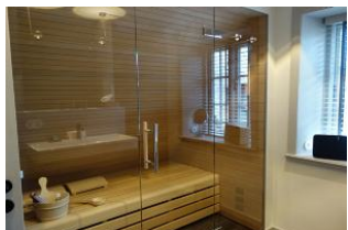
Im Bad integriert, die Sauna