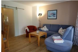
Das Wohnzimmer mit gemütlichem Sofa