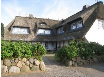
Das Eckhus im Hochstieg 22

Die Unterkunft verteilt sich über EG, 1.OG und DG.