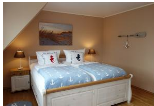
....noch einmal das Bett.