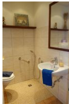
Das Gäste - WC im Erdgeschoß mit "Fusswaschstelle"