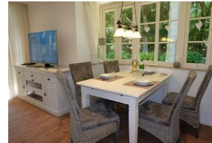
...der Tisch ist schon gedeckt !