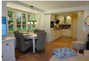
Derr Esstisch, die offene Küche.