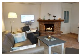
Couch und zwei Sessel. Kamin und TV Gerät. Es wird Ihnen an nichts fehlen für einen gemütlichen Abend