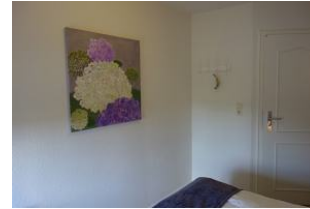
Ein Hortensienbild, ebenfalls im lila-Ton