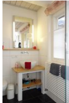
Das Bad im Erdgeschoß...