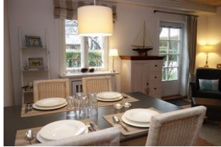
Der große Essplatz im Wohnzimmer.