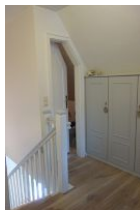
Der Flur im Obergeschoß. Hier finden Sie noch genügend Platz in den Einbauschränken. Die Tür führt in.....