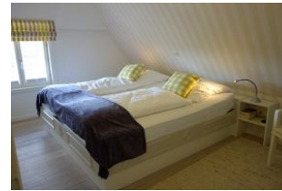
Das grüne Schlafzimmer... Bettmaß ebenfalls 200x200cm