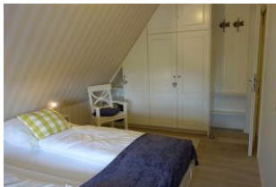
... mit Einbauschränk.