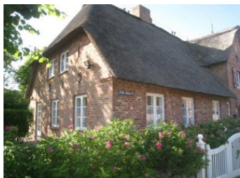
Ein Teil des Hahnenhofes, hier die Wohnung 6

Die Unterkunft verteilt sich über EG und 1.OG.