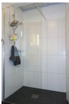
...mit großem Duschbereich.