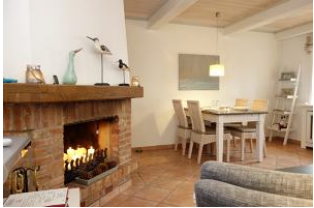
Der Blick zum Esstisch.