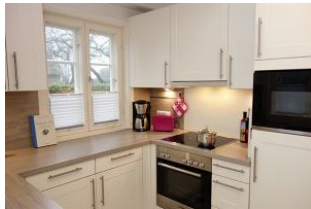
... Backofen und Mikrowelle