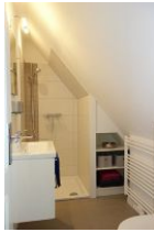
...ein kleines, neues, tolles Duschbad.