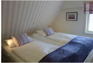
Das "lila" Schlafzimmer mit Doppelbett (200x200cm)