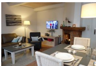
...mit Kamin und TV Gerät