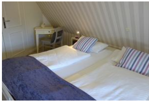
...und kleinem Schreibsekretär.