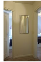
Vom Flur geht es in zwei Schlafzimmer.