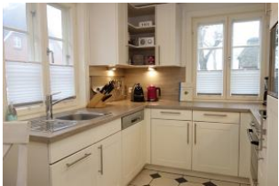
Die separate Küche mit...