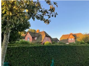
Die Häuser Dörpstrat 93+93a Das linke Haus ist die Nummer 93a