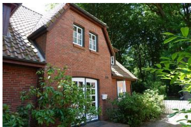
Die Aussenansicht des Hauses Eulenkamp 6c

Die Unterkunft verteilt sich über EG und 1.OG.