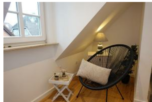
Das Lesezimmer im OG