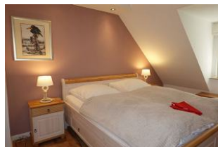
Das Elternbett misst 180x200cm