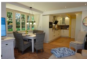
Derr Esstisch, die offene Küche.