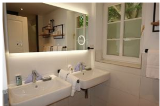
Das Bad im OG mit zwei Waschtischen