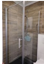
Die bodengleiche Dusche im Erdgeschoß.