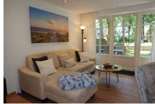
...machen Sie es sich gemütlich!