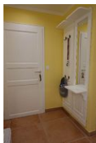
...der Eingangsbereich mit Garderobe