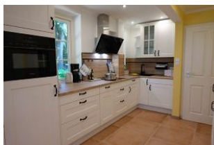
...hier die Küche von der anderen Seite aus gesehen.