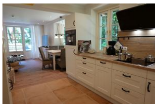
...der Blick in die Küche und zum Essplatz