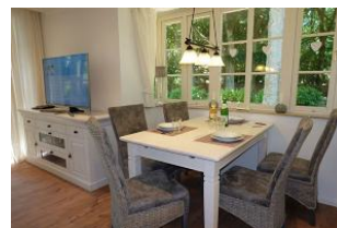
...der Tisch ist schon gedeckt !