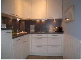
... mit allem Drum und Dran.