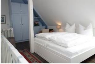
Das Doppelbett 180x200cm auf der Galerie, sowie...