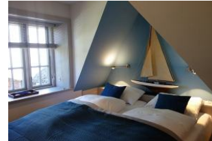
Das Doppelbett im "blauen" Schlafzimmer...