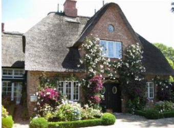
Reethus 5, ein Hausteil mit Stil.

Die Unterkunft verteilt sich über EG und 1.OG.