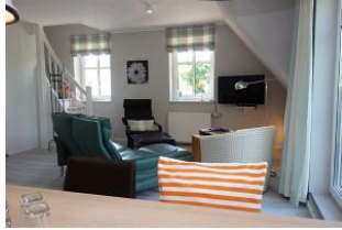
Der Blick von der Küche zur Wohnecke.