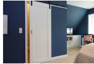
...und begehbarem Kleiderschrank.