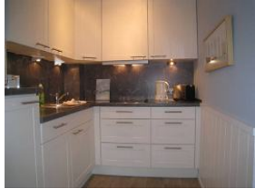
... mit allem Drum und Dran.