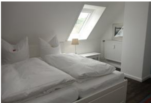
...ein Fenster um die frische Luft herein zu lassen.