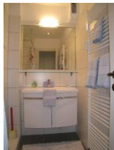
Das Bad mit Waschtisch...