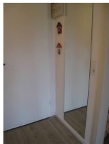
Der Eingangsbereich mit großem Spiegel.