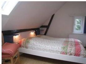
Ein zweites Schlafzimmer mit Doppelbett 160x200cm ...