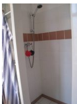
...die gemauerte Dusche, die zwei Handbrausen bereit hält....