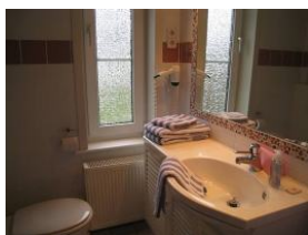
Bad im Erdgeschoß: Toilette, Waschbecken, großer Spiegel und ...