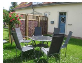
Herrlich idyllischer Freisitz, im Hintergrund die blaue Eingangstür zur Wohnung Picasso.