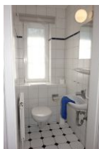
Das Gäste - WC im Erdgeschoss