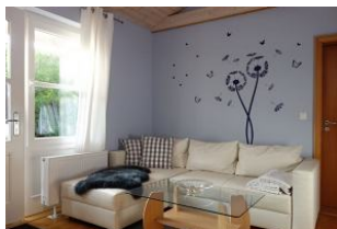
....nehmen Sie Platz.....