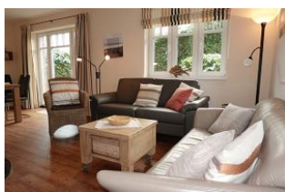
Zwei Sofas garantieren einen gemütlichen Abend

Dieses Einzelhaus in der Flurstrasse in Wyk, läßt Urlaubsherzen höher schlagen. Herrlich für Familien. Vier Schlafzimmer geben jedem Familienmitglied eine Rückzugsmöglichkeit. Der gemeinsame Wohn- Essraum mit halb offener Küche dient der Kommunikation. Zwei Bäder lassen auch am Morgen nicht das Frühstück in unendliche Ferne rücken. Das Fensteröffnen zum lüften ist nicht nötig, das Haus verfügt über eine zentrale Lüftungsanlage, die einen hohen Komfort der Raumluft garantiert. Hier wurde an Alles gedacht, seien Sie gespannt. Ach übrigens, sind Sie vielleicht Schachspieler ? Im Garten befindet sich ein 4x4 m großes Schachfeld aus Steinplatten, den Schlüssel zum Schrank für die großen Figuren bekommen Sie bei uns !