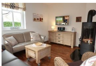
Das TV Gerät und Ofen