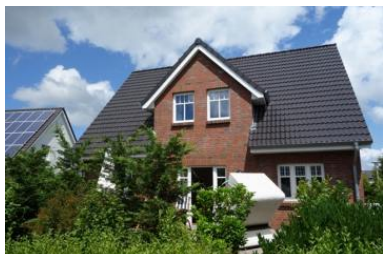
Das Haus Flurstrasse 28

Die Unterkunft verteilt sich über EG und 1.OG.