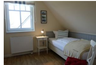
Ein Schlafzimmer im OG mit Einzelbett, auch hier großer Kleiderschrank und TV - Gerät. (nicht im Bild)