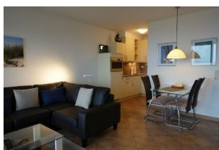
...die Eckcouch, im Hintergrund der Essplatz und die offene Küche