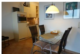
Der Esstisch, direkt vor der Küche - praktisch.