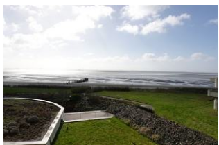
Der Blick auf das Meer - bei jedem Wetter faszinierend.