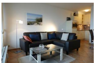
...wer mag sich hier nicht niederlassen ???