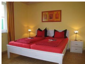
Das Schlafzimmer mit Doppelbett 180x200cm Nicht im Bild: Kleiderschrank + TV Gerät.

Die Terrasse ist gleichzeitig der Eingang zur Wohnung