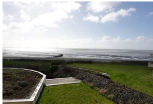
...dieser Aussicht gibt es nichts mehr hinzuzufügen....