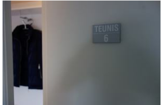
Die Wohnung 6 befindet sich im 2.OG links