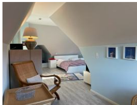
...das Dachzimmer, herrlich gemütlich: