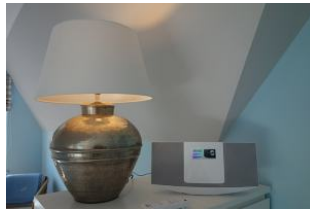
...und eine Musikanlage.