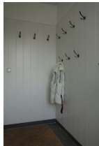
Vorflur und Garderobe zur Whg. 10

...wer ist eigentlich "Paul" ? Unsere Häuser Paul und Paula stehen dort, wo einmal die Pension "Vier Jahreszeiten" stand. Eine großzügige Wohnung über zwei Etagen und mit allem Komfort erwartet Sie im Haus Paul. Man spürt, hier wurde jedes Möbelstück einzeln ausgesucht. Mit viel Liebe zum Detail entstand hier eine Farbharmonie, wie man sie selten findet. Gemütliche Sitzmöbel wie die Couch mit verstellbaren Rückenlehnen, ein Pöng von IKEA, wie wir ihn alle kennen, bequeme Stühle am Esstisch, und, und, und. Sehen Sie selbst und fühlen Sie sich wohl, wir haben unser Bestes gegeben. Perfekt auch für Golfer. Die Entfernung zum Golfplatz beträgt nur 2,6 km