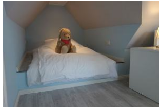
...die wir auf Wunsch auch zum Bett umfunktionieren können.