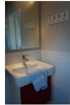
Auch im Dachgeschoß befindet sich ein kleines Bad mit Waschtisch, Toilette (nicht im Bild) und...