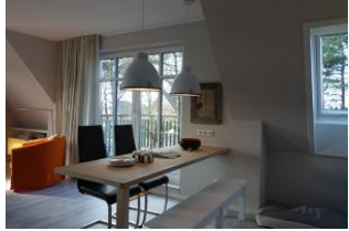
Der Esstisch teilt den Wohnbereich vom Küchenbereich