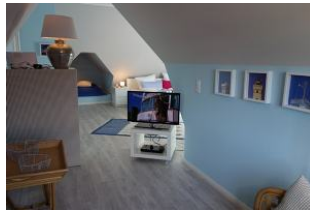
...wer mag, kann den TV-Tisch auch zum Bett drehen !