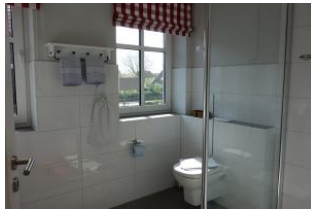
... Toilette und ...