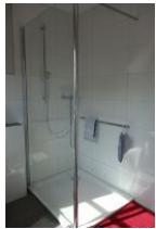
...herrlich großer Dusche mit Glaswand.