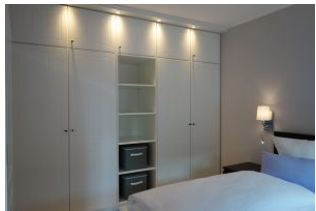
Genügend Schrankraum !