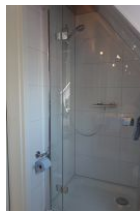
...Duschkabine mit Echtglas.