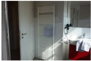
Das Bad mit Waschtisch, Handtuchheizung....