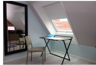
...ganz neu: ein Home-office-Platz