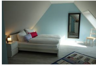
...großes Doppelbett 180x200cm ohne Fussende