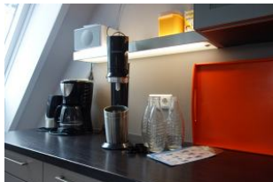
....kein-Flaschen-schleppen mehr ! Ein Soda Stream mit Echtglas-Flaschen.....