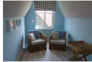
Bequeme Sessel laden als Rückzugsort ein. Auch hier gibt es ein TV-Gerät