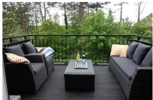
....entspannend, der Balkon mit Lounge Möbeln