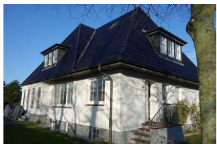
...man muss einmal um das Haus gehen um zum Eingang - ein paar Stufen hoch - zu kommen. Links "Ihre" Terrasse im Winterschlaf.

Die Wohnung 1 im Erdgeschoss des Hauses Schwalbenweg 10 in Wyk! Herrlich, großzügige Wohnung im Erdgeschoss für 2 Personen. Das Wohnzimmer mit gemütlicher Couch und Lesesessel, im Wintergarten ein großer Essplatz, sep. vollständig eingerichtete Küche, das Schlafzimmer mit großem Doppelbett 180x200 ohne Fussteil und ein Duschbad. Ruhe pur im Schwalbenweg, der Südstrand fußläufig zu erreichen, der Bäcker "um die Ecke".....so muss Urlaub sein.