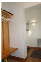
Treten Sie ein, Sie sind angekommen.