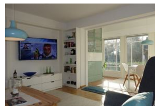
Der Blick von der Couch zum TV