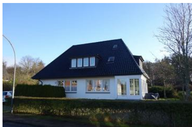
Das Haus Schwalbenweg 10 Die Whg. 1 befindet sich rechts im Haus