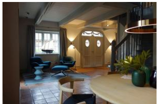
Der Blick zur Haustür

Dieses traumhafte Hausteil wurde im Frühjahr 2020 komplett saniert und neu eingerichtet. Seien Sie gespannt auf ein großzügiges Erdgeschoß mit offenen Räumen ohne störende Türen (friesischer Rundgang), tolles Ambiente, moderne Einrichtung, technische Raffinessen (5x Sonos Box) Küchenschränke mit Touchfunktion, Vollflächiger Induktionsherd, Sauna im Bad im OG, zwei Schlafzimmer mit großen Doppelbetten, eins mit zweitem TV Gerät. Durch dies Haus muß man einmal durchgehen, alles ausprobieren, sich setzen und auf sich wirken lassen. Toll, seien Sie gespannt auf dieses 5 Sterne Haus !