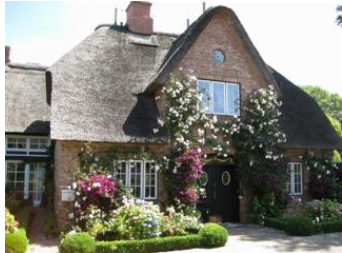
Reethus 5, ein Hausteil mit Stil.

Die Unterkunft verteilt sich über EG und 1.OG.