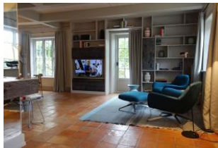
Blick auf Relaxsessel und das TV Gerät (voll schwenkbar) im Hintergrund der Essplatz