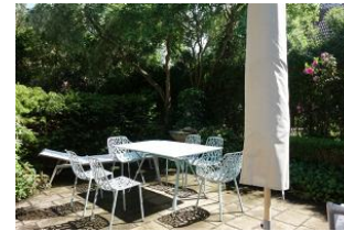
...herrlich eingewachsene Terrasse, Tisch und Stühle, 2 Liegen.