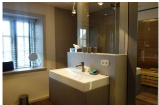
Das Bad im Obergeschoss. Hinter der Glaswand befindet sich .....