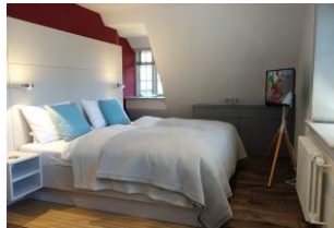
Das große Doppelbett im "roten" Schlafzimmer, TV