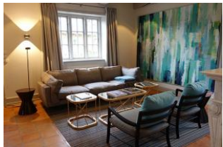
Große, gemütliche Couch, 2 Sessel, nicht im Bild der Kamin