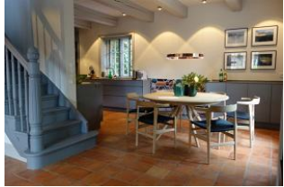
Der Essplatz mit Blick zur TV - Sitzcke oder zur Küche