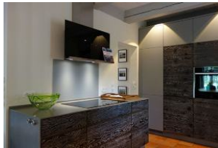
Das Vollinduktionsbedienfeld, hier kocht es sich fast wie von allein