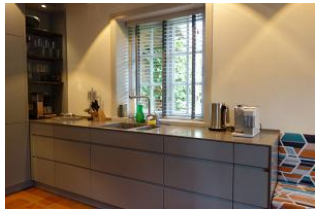
Ein Teil der Küche, hier die Spüle