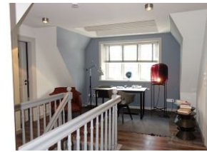
Der Flur im OG mit Schreibtisch für kreative Gedanken.