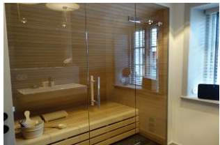
Im Bad integriert, die Sauna