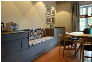
eine zusätzliche Sitzbank am Esstisch