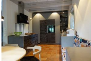
Die offene, hochmoderne Küche...