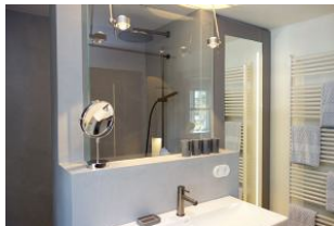
...hinter dem großen Spiegel verbirgt sich ....