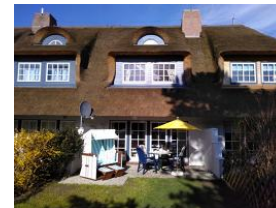
Die Terrasse bei herrlichem Wetter.....